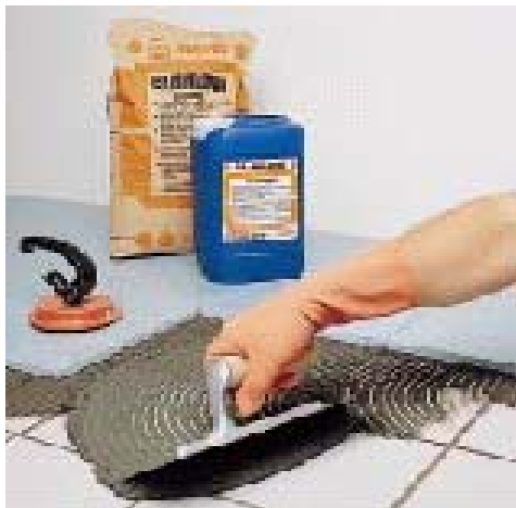
Укладка агломератных плиток на существующие керамические полы

Проверка производится путем прикосновения пальцами к нанесенному клею. Если клей остается на пальцах, можно продолжать укладку. Если пленка образовалась, подсохший клей необходимо удалить и нанести зубчатым шпателем свежий слой.