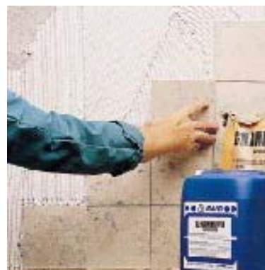
Укладка юрасского мрамора