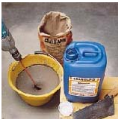
Замешивание серого или белого GRANIRAPID

Смешайте содержимое упаковки компонента А (25 кг порошкообразной смеси) с содержимым упаковки компонента В (5,5 кг латекса искусственного каучука). Всегда следует высыпать при постоянном помешивании.