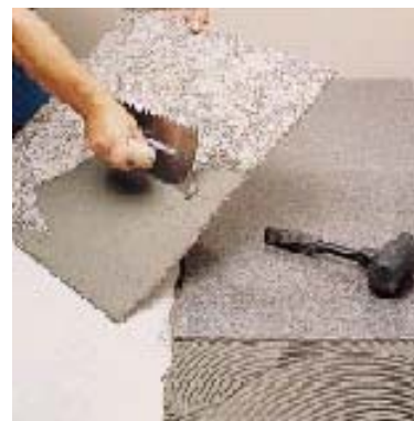
Укладка гибкого синтетического гранита

При нормальной температуре и влажности слой GRANIRAPID , нанесенный на облицуемую поверхность, находится в рабочем состоянии около 20 минут. При неблагоприятных погодных условиях (палящее солнце, сухой ветер, высокая температура), а также на сильно поглощающих поверхностях рабочее время может значительно сокращаться (до нескольких минут). Для увеличения рабочего времени клея рекомендуется перед его нанесением увлажнять облицуемую поверхность. Для оценки состояния нанесенного на основание клея периодически проверяйте, не образовалась ли на его поверхности пленка.