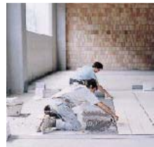
Укладка фарфоровой неглазурованной плитки на производстве