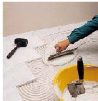
Укладка каррарского мрамора