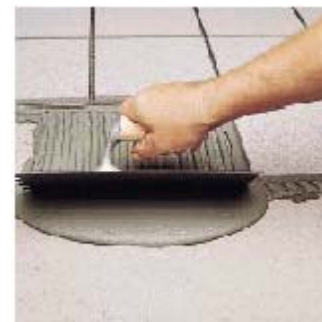
Укладка толстой фарфоровой неглазурованной плитки

В случаях, требующих высокого качества облицовки, а именно при облицовке: