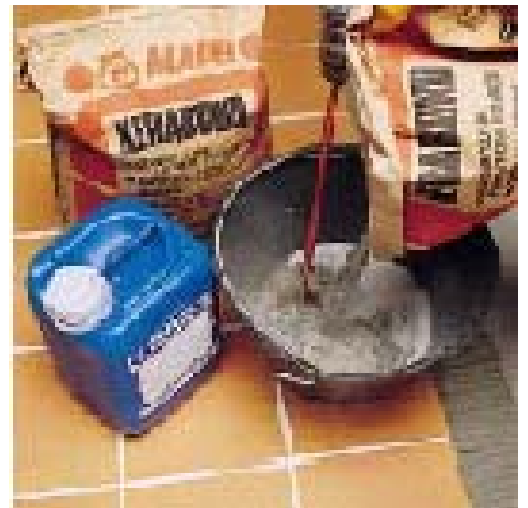
Укладка плитки на систему обогрева пола