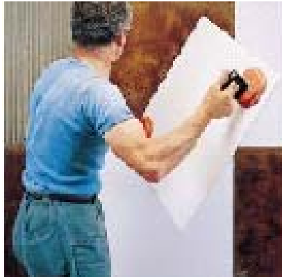
Укладка плитки на стену