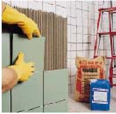
Укладка плитки на старую плитку