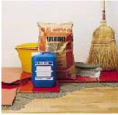
Укладка плитки на старый паркет