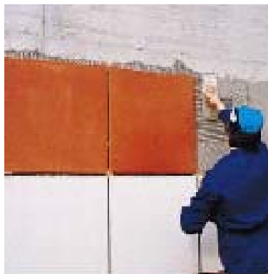
Укладка крупноформатной плитки с помощью системы KERABOND+ ISOLASTIC