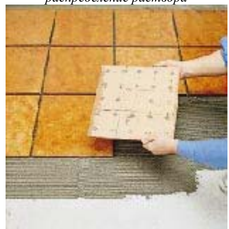
недостаточное покрытие клеем