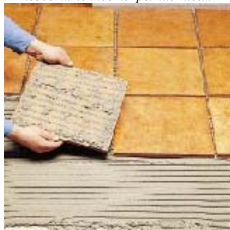
достаточное покрытие клеем